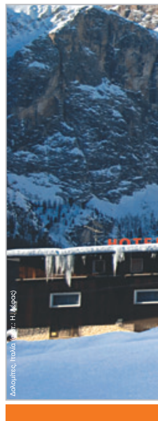
Δολομίτες, Ιταλία

Μιά μονάδα θέρμανσης, υψηλού βαθμού απόδοσης, προσεγγίσιμη σε όλες τις λεπτομέρειες, με εξαρτήματα και υλικά υψηλής ποιότητας και αντοχής, που σέβεται το περιβάλλον