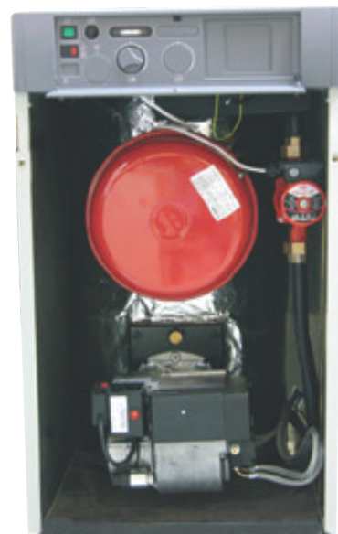
Νέος χαλύβδινος λέβητας με φλογουαλούς